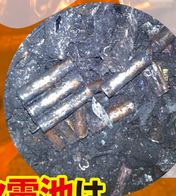
モバイル バッテリー