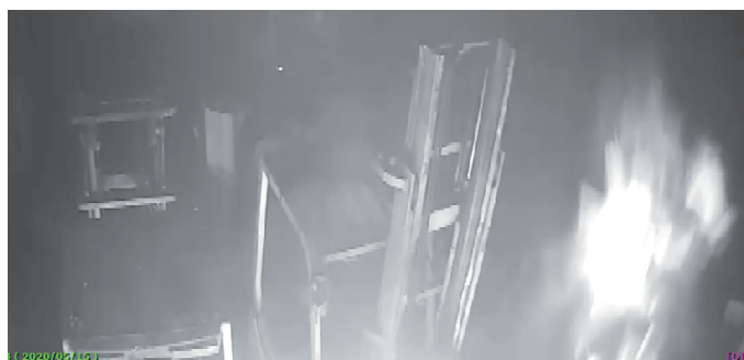
火の粉が上がる防犯カメラ映像▲

排出事業者の皆様には、危険物等の混入防止に特段のご理解ご協力をいただきますようお願いいたします。