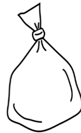
感染性廃棄物を表す表示 (バイオハザードマークなど) のないポリ袋等