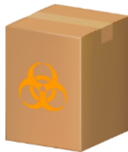
段ボール容器 (内袋使用)