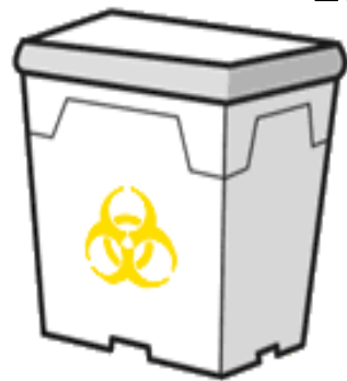
プラスチック製容器