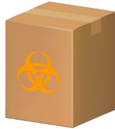
段ボール容器 (内袋使用)