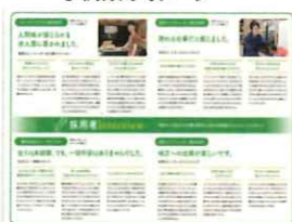
事例集のイメージ