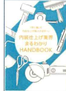
業界PR冊子のイメージ