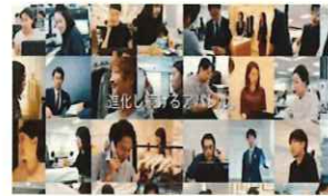
業界PR動画のイメージ